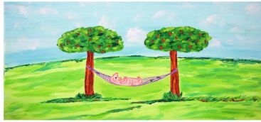
Echt Havelländer Apfelschwein